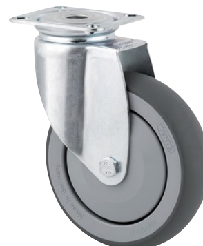
La foto puede diferir del producto original